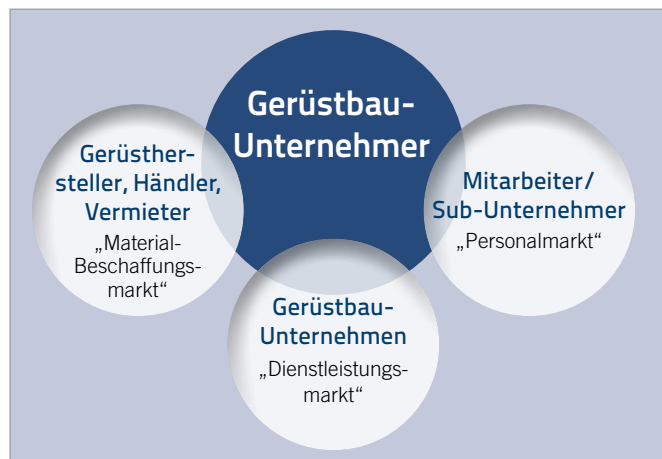
Abb. 1: Gerüstbau-Unternehmer innerhalb der drei Hauptspannungsfelder

Schlagworte hierbei sind: Produktivität des eigenen Unternehmens, Akquise-Strategie, Kontakte, Alleinstellungsmerkmale, Betriebsorganisation, rechtliches Umfeld etc.