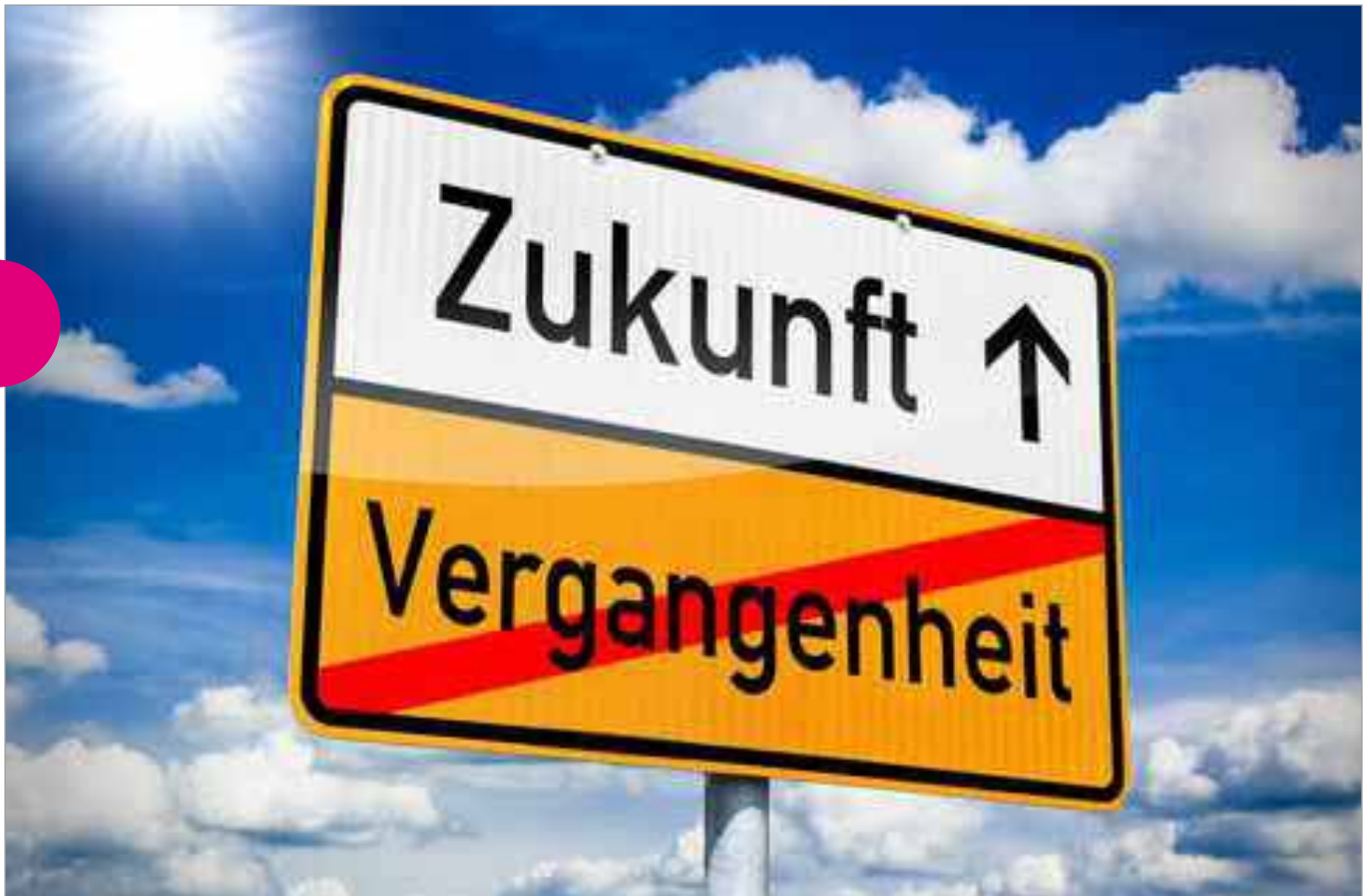
Datei: #41812681